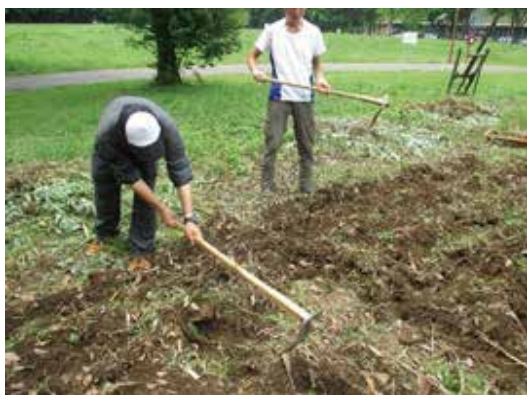
畑を耕すところからスタート！

昨年に引き続き、筑波大学内で福島ひまわり里親プロジェクトを行いました！6月に種をまき、みんなで協力して水やりなどを行って来て、7月の下旬から8月の中旬にかけて綺麗なひまわりの花が開花しました！これから種の収穫に入る予定です。