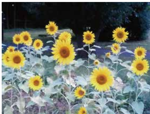
たくさんのひまわりが咲きました。

※福島ひまわり里親プロジェクトとは 全国にいる「里親」さんがひまわりを育て種を収穫し、福島に送ること、雇用対策、風化対策などにつなげようという試み。