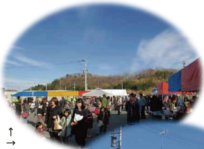
↑ 様々な屋台やステージで大賑わいのダルマ市