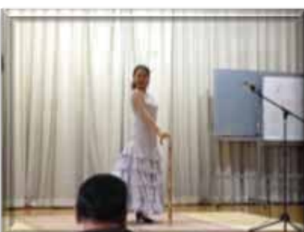
↑ 力強さと美しさを兼ね備えた フラメンコは最高でした！