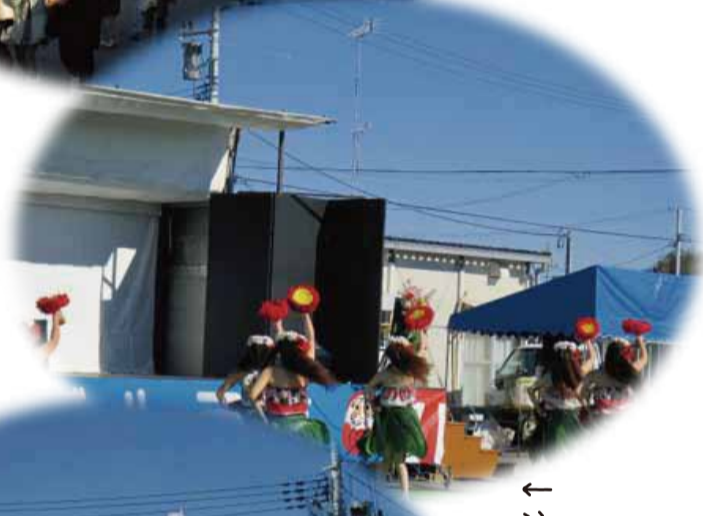
↑ 注目のダルママシ