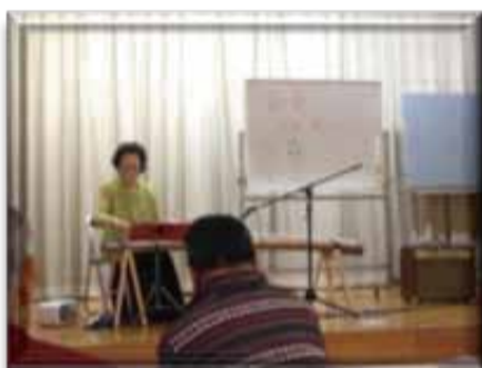
↑ お琴の演奏。 とても心地よい音色でした。