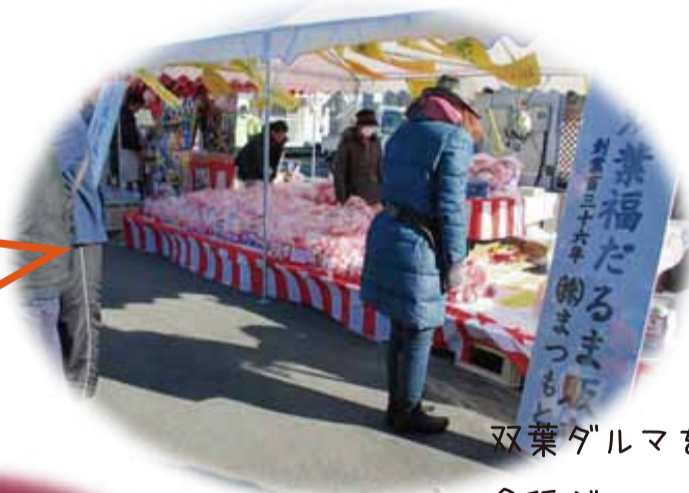
双葉ダルマをはじめとした各種ダルマの販売