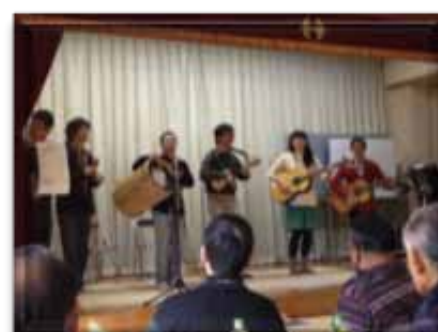
↑ 最後は筑波大学の フォルクローレサークルの演奏で 締めくくりました！

先日1月19日に開催された今年最初のしゃべり場にお邪魔させていただきました。しゃべり場とは、元気つくば会が毎月一回開催する交流会のことで、今回は「新春芸能を楽しむ会」と題しまして、皆さんのとっておきの隠し芸を楽しむ会でした。 予想以上の素晴らしい芸の連続で、いつものしゃべり場とはうってかわって拍手や歓声が飛び交う会となりました。僕自身ずっと見入ってしまうほど本当にすごい芸ばかりでした。たまにはこういうのもいいですね！この芸能を楽しむ会ですがまたいつか開催するようなので、その時までには自分も頑張っ て皆さんに負けないような一芸を磨こうと思いました。 たくさん笑顔にあふれ、皆さんの普段とは違う一面が見られた大満足の日でした。ありがとうございました！