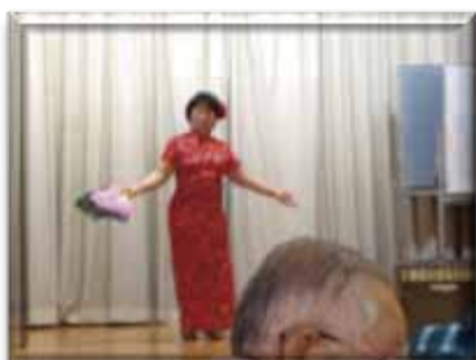
↑ 華麗な舞！衣装変化には びっくりしました。