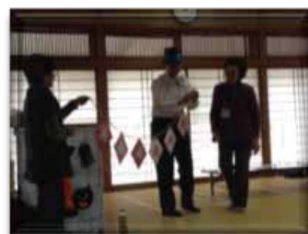
↑ 次から次へと 繰り出されるマジックに 皆さん釘づけでした！