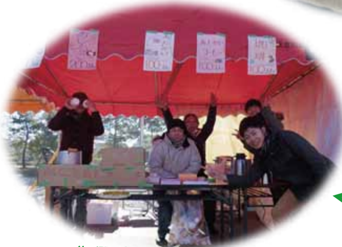
なごも復興プロジェクトの皆さんとパチリ☆

今回、私たちはなごも復興プロジェクトの皆さんのお手伝いをさせていただきますました！