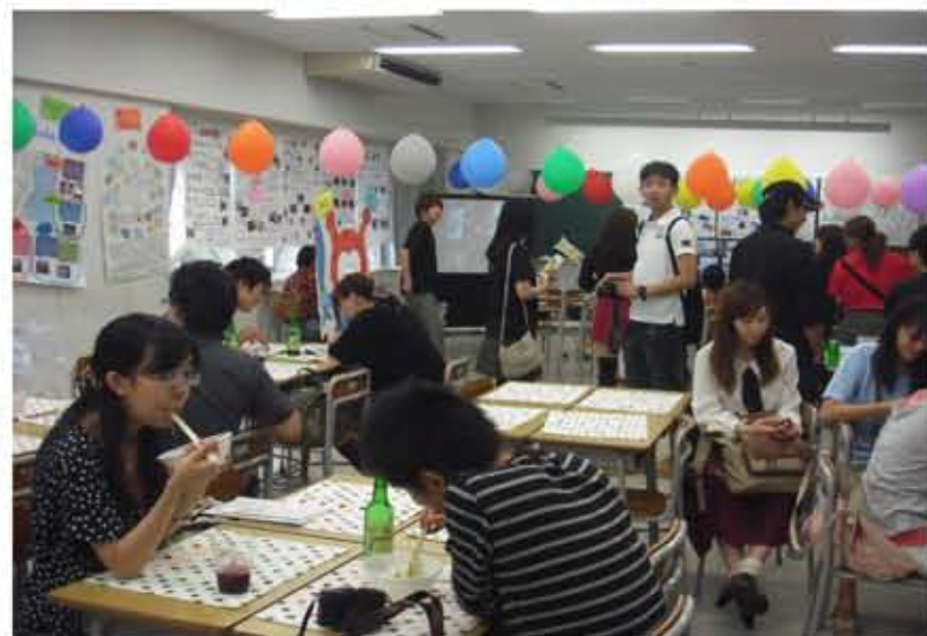
こんなにたくさんの方に足を運んでいただきました。大感激！！

多くの方がこの東北復興カフェをきっかけとして東北に触れ、東北を知ることができたのではないかと思います！