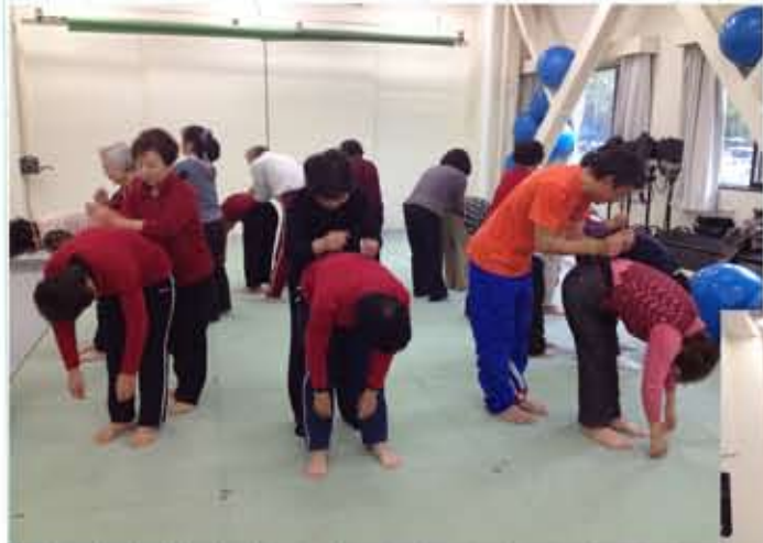
腰をトントン きもちいい～

実はこの日の双葉町出身の参加者は3名。1日に筑波山ツアーに行かれた疲れで、皆さんお風邪をひかれていますそうです。筑波嵐が吹く筑波の冬は寒いので、あたたかくしてお大事になさってくださいね。