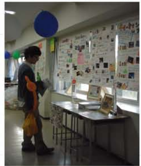
展示にも力を入れました！

先日十月六日（日）に、筑波大学学園祭が開かれ、Tsukuba for 3.11 として東北復興カフェと題して東北の美味しい食べ物販売させていただきました。当日は、東北から仕入れた自慢の食品の他に、Tsukuba for 3.11の活動紹介ポスターの展示、被災地の現状と伝えたい写真の展示、現地の方からのメッセージの放映も行いました。メニューも、準備から当日の運営まで大奮闘しながらも、多くの方に足を運んでいただき、とても意義のある学園祭となりました。