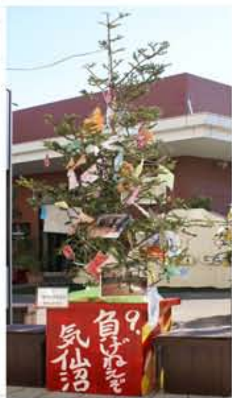
↑ 今年のツリー。 想いのつまったツリー となっています。

Tsukuba for 11で は昨年に続き今年もツリ を創作・展示させてい ただくことになりました。 今年のテーマは「ツリー のためのツリー」 想いのつまったツリー の皆さんのツリーを是非 ださい!!