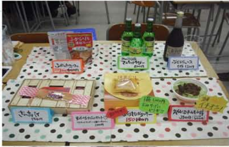
学園祭で出品したメニュー。どれも自慢の品です！